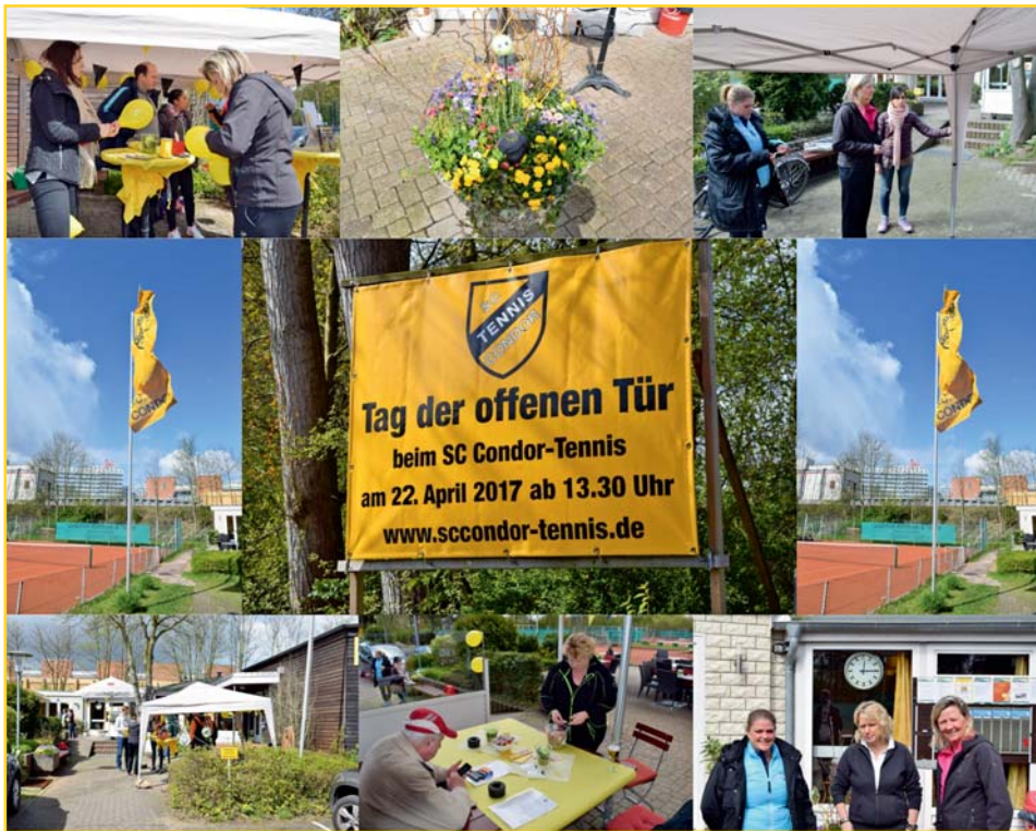
Vielen Dank an die vielen fleißigen Helfer beim Tag der offenen Tür beim SC Condor Tennis!

Bestattungshaus M. Sippli Feuer- und Seebestattungen komplett